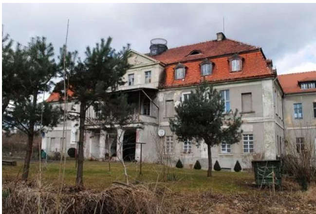
Rysunek 25. Widok na Pałac w Szyszkiej Górnej.

odbudowany. Obecny kształt otrzymał w II poł. XVIII wieku jako reprezentacyjna budowla w stylu barokowego założenia - entre cour et jardin. Na przełomie XIX/XX wieku dobudowano wschodnie skrzydło. Kolejna renowacja obiektu miała miejsce w 1926 roku, podczas której powstało piętro poddaszowe oraz dach mansardowy. Prace budowlane były także prowadzone wewnątrz pałacu. Do II wojny światowej obiekt pozostawał