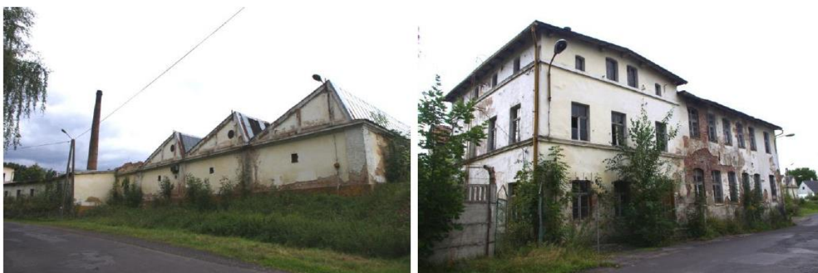
Rysunek 34. Widok na budynki fabryki Tkanin Meblowych „Fatma”.