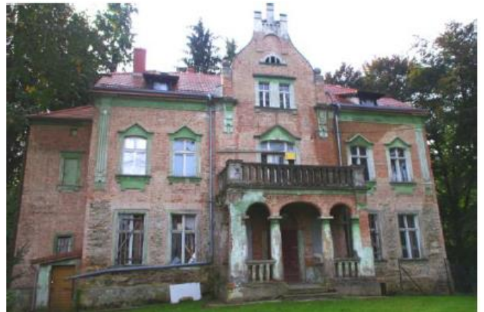
Rysunek 19. Widok na pałac w Grabiszycach Dolnych.

W 1991 roku majątkiem zarządzała Agencja Rolna Skarbu Państwa. Obecnie obiekt stanowi własność prywatną. Park krajobrazowy powstał w II poł. XIX wieku w oparciu o naturalnie ukształtowany teren.