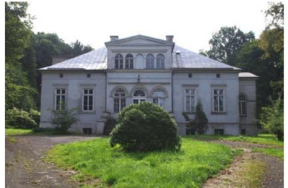
Rysunek 21. Widok na willę w Grabiszycach Górnych.