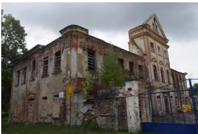
Rysunek 18. Widok na Pałac w Baworowie.

Architektura: Budynek dwukondygnacyjny o narożach lekko zaokrąglonych. Dłuższa elewacja składa się z 13 osi, krótsza z 5 osi. Środek frontowej i ogrodowej elewacji akcentują 3-kondygnacyjne, 3-osiove ryzality, zwieńczone naczótkami. Elewacje