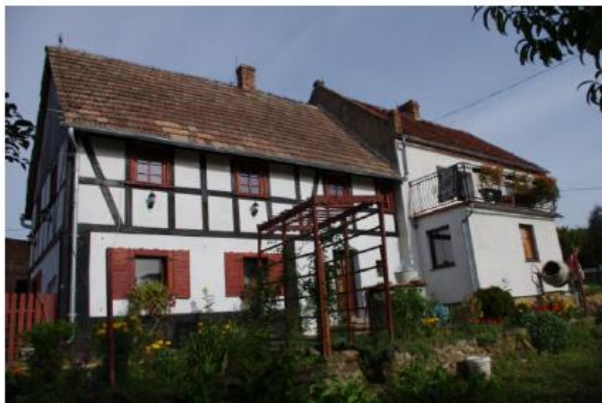
Rysunek 28. Przykład budownictwa o konstrukcji szkieletowej - budynek mieszkalny w Grabiszycach Dolnych 21.

Kolejnym oryginalnym rozwiązaniem jest zastosowanie tzw. przystupów - pionowych belek przylegających do ścian lub wolnostojących. Te elementy konstrukcyjne przejmowały ciężar z reguły dwuspadowego dachu pokrytego łupkiem, później dachówką. Powstałe wnęki zwieńczone belkami rozporowymi tzw. mieczami tworzyły rząd arkad, względnie arkadowe podcienia.