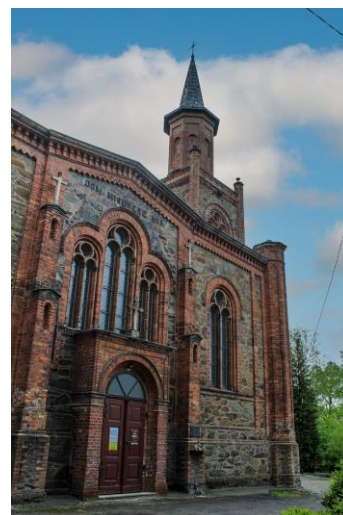
Rysunek 4. Widok na Kościół p.w. św. Jana Chrzciciela w Leśnej.

Zakres proponowanych prac: Wykonanie izolacji pionowej i poziomej, właściwego odpływu wody z rynien oraz wyłożenie np. kostką granitową lub materiałem zgodnym z zaleceniami konserwatorskimi drogi komunikacyjnej wokół kościoła.