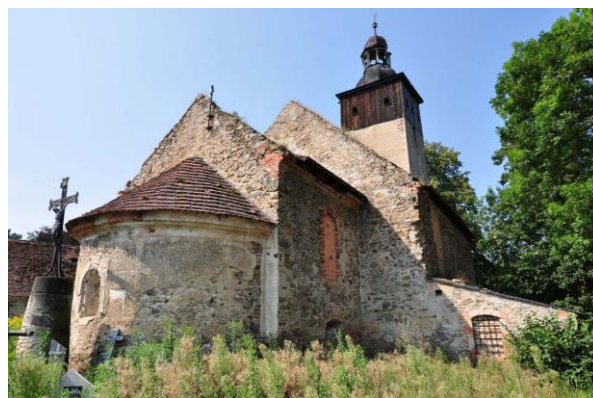
Rysunek 10. Widok na Kościół filialny pw. NMP w Kościelnikach Średnich.

Kościół powstał jako budowla orientowana, zbudowana z kamienia łamanego i z grubsza ociosanego piaskowca (wykorzystanego w ościeżach okien), składająca się z prostokątnej nawy o wymiarach 12,2 x 10,5 metra, czworobocznego, prawie kwadratowego prezbiterium o wymiarach 5,2 x 5 metrów i przylegającej do