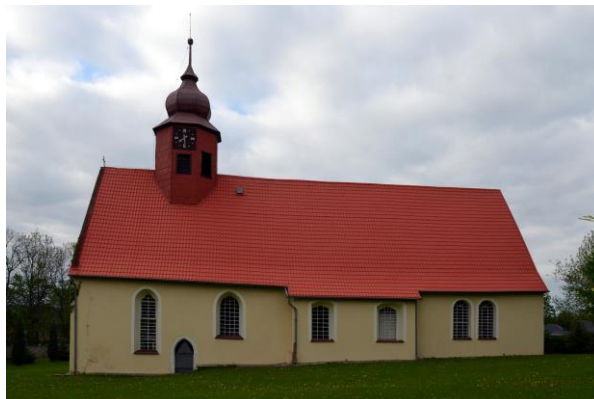
Rysunek 12. Widok na Kościół filialny pw. MB Anielskiej w Stankowicach.

Kościół wzmiankowany w 1346 r., wzniesiony w latach 1606-11 lub 1617-24, w 1743 r. do istniejącego korpusu dostawiono kolejną część nawy. Jest to budowla prostokątna o wydłużonym korpusie z dwuspadowym dachem. Ponad kalenicą ośmioboczna sygnaturka, zwieńczoną cebulastym hełmem, w elewacjach portal i okna w ostrołukowych kamiennych opaskach. We wnętrzu zachowały się m.in. drewniany, polichromowany ołtarz z XVIII w., polichromowana ambona z XIX w., organy z początku XX w.