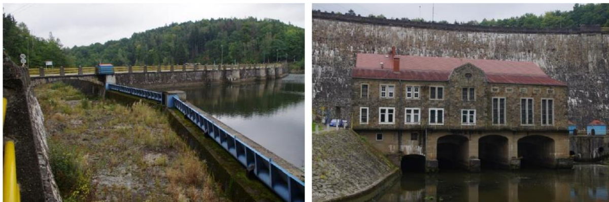
Rysunek 32. Widok na zaporę (od lewej) i budynek elektrowni (od prawej) na Jeziorze Złotnickim.