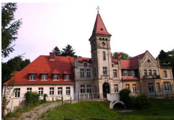
Rysunek 20. Widok na Pałac w Grabiszycach Średnich.