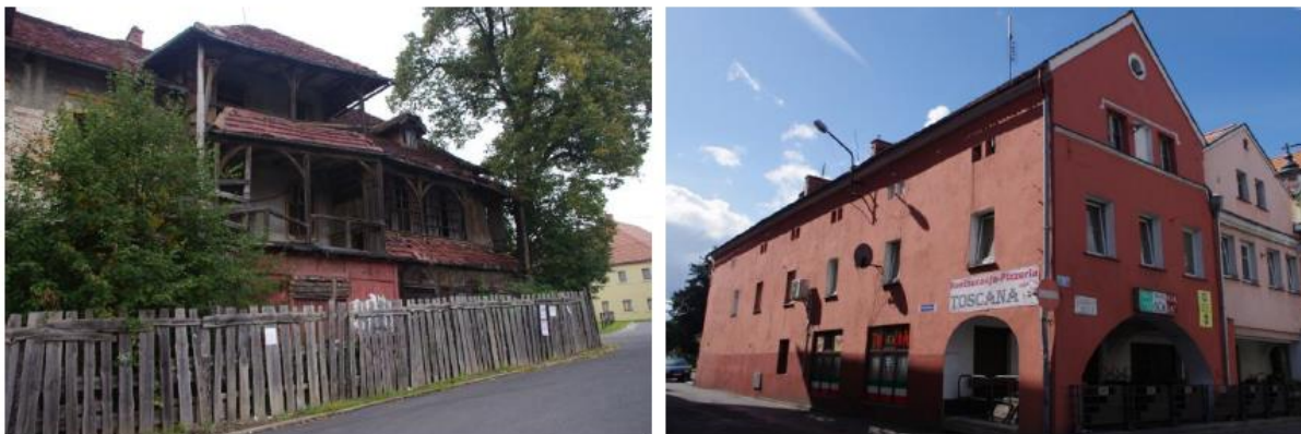
Rysunek 27. Widok na budownictwo zlokalizowane w Złotnikach Lubańskich - od lewej zdegradowany budynek Ratusza, od prawej kamienica zlokalizowana przy ul. Rynek 9 w Leśnej.

Stan zachowania: W kamienicach ujętych w Lokalnym Programie Rewitalizacji obserwuje się w większości zdegradowaną elewację zewnętrzną, niszczący dach, brak izolacji poziomej oraz pionowej. W bardzo złym stanie znajdują się obiekty w rękach prywatnych. Przykładem jest Ratusz w Złotnikach Lubańskich, który ulega ciągłej degradacji.