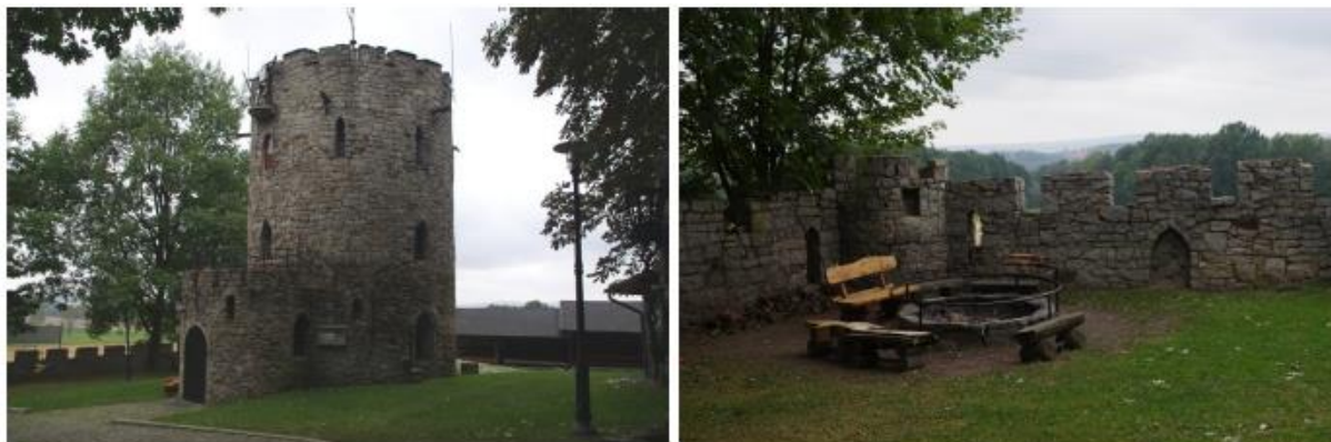
Rysunek 38. Widok na kamienną szubienicę.