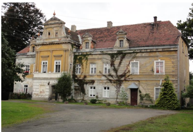
Rysunek 23. Widok na dwór w Kościelnikach Średnich.

Architektura: Budowla osadzona na planie prostokąta, jednokondygnacyjna z poddaszem, okryta mansardowym dachem. Wejście znajduje się w wysuniętym centralnie ryzalicie