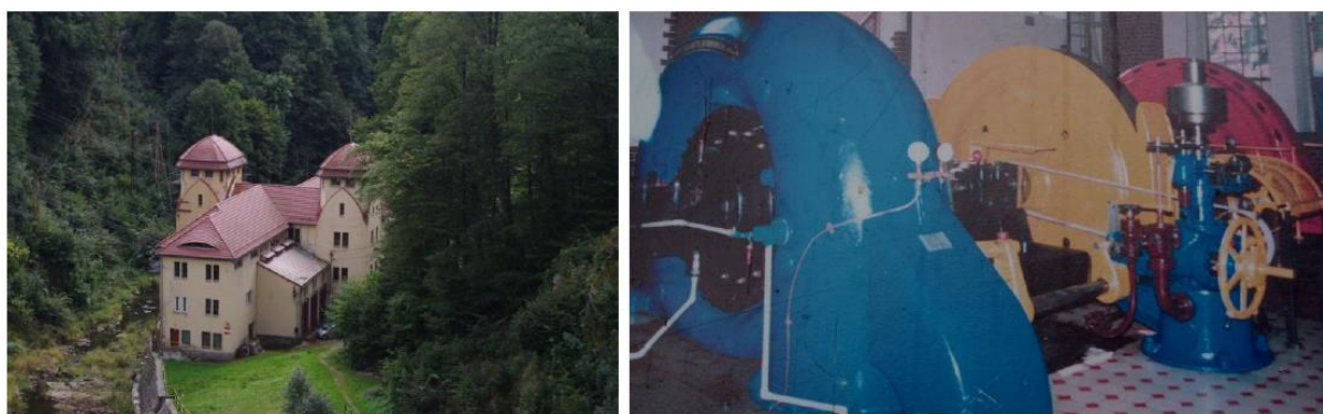
Rysunek 31. Widok na budynek elektrowni Leśna (od lewej) oraz wnętrze elektrowni (po prawej).

Architektura: Stylowo budowla jest przykładem eklektyzmu, łączącego neoklasyczny detal architektoniczny (zwieńczenie korony fryzem arkadowym) z detalem neogotyckim (przy prawym przyczółku wieżyczka neogotycka). Zespół tworzą: dwa tzw. domki zasuw dennych (na poziomie korony zapory), dwa tzw. domki zasuw rurociągów turbinowych (poniżej zapory), dom mieszczący pierwotnie biuro dyrektora budowy obiektu - obecnie dom mieszkalny, budynek techniczny, dwie sztolnie obiegowe (L, P) wreszcie - budynek elektrowni.