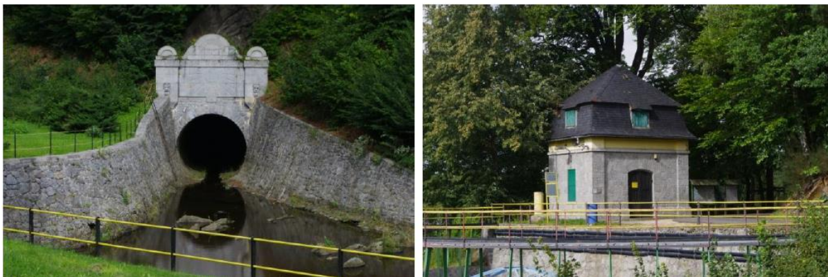
Rysunek 30. Widok na Sztolnię obiegową (od lewej) oraz Domek zasuw dennych (po prawej).

Architektura: Stylowo budowla jest przykładem eklektyzmu, łączącego neoklasyczny detal architektoniczny (zwieńczenie korony fryzem arkadowym) z detalem neogotyckim (przy prawym przyczółku wieżyczka neogotycka). Zespół tworzą: dwa tzw. domki zasuw dennych (na poziomie korony zapory), dwa tzw. domki zasuw rurociągów turbinowych (poniżej zapory), dom mieszczący pierwotnie biuro dyrektora budowy obiektu - obecnie dom mieszkalny, budynek techniczny, dwie sztolnie obiegowe (L, P) wreszcie - budynek elektrowni.