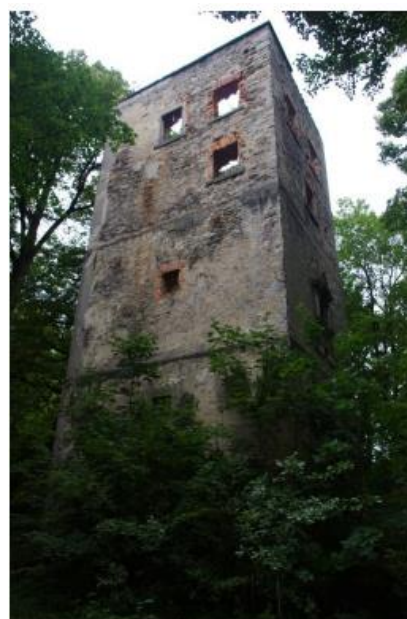
Rysunek 36. Widok na Wieżę Cesarza Wilhelma.