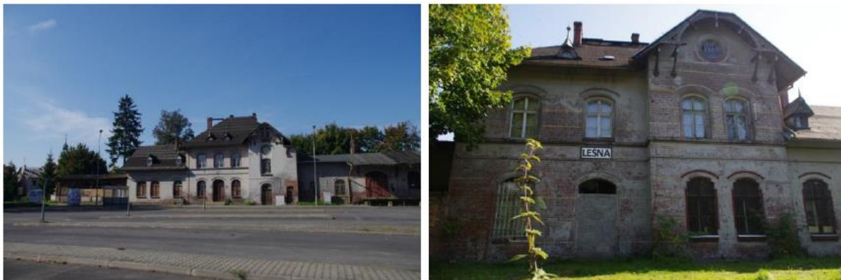
Rysunek 35. Widok na budynek Dworca PKP w Leśnej.