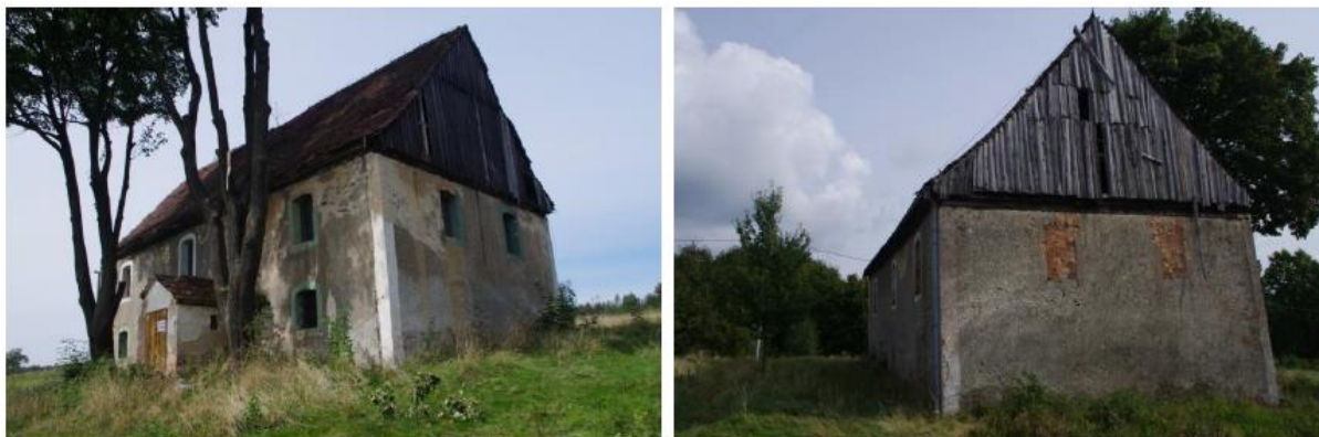
Rysunek 7. Widok na Zbór Braci w Grabiszycach Średnich.

Historia: Świątynia została wybudowana w 1733 roku. W latach powojennych służyła jako katolicka kaplica mszalna Matki Boskiej Różańcowej. Na uwagę zasługuje fakt, że jest to prawdopodobnie jedyna w polskiej części Łużyc Górnych świątynia husycka.