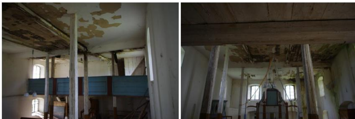
Rysunek 8. Widok na wnętrze świątyni.

Architektura: Niewielka murowana budowla sakralna przykryta dwuspadowym drewnianym dachem zwieńczona pierwotnie więżą z sygnaturką. Obecnie wieża uległa zawaleniu.