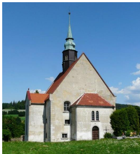
Rysunek 13. Widok na Kościół filialny pw. Najświętszego Serca P. Jezusa w Świeciu.

Architektura: Jest to budowla orientowana, z kwadratowym korpusem, płytkim prezbiterium o ściętych narożach, kruchtą od południa i piętrową dobudówką z zakrystią. Na kalenicy dwuspadowego dachu stoi drewniana, ośmioboczna sygnaturka z iglicowym hełmem, w elewacjach dwa rzędy okien. Wnętrze nawy nakrywa drewniany strop kasetonowy z 1718 r., z przestawieniami portretów 48 postaci biblijnych. Na parapetach empor temperowe obrazy z przedstawieniami wydarzeń nowotestamentalnych, ozdobne, oszklone łoże kolatorskie.