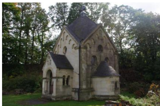
Rysunek 11. Widok na Kaplicę Grota w Kościelnikach Górnych.

Historia: Neoklasycystyczna kaplica została wybudowana na przełomie XIX i XX wieku jako mauzoleum rodziny von Carnap, ostatnich właścicieli wsi rezydujących w miejscowym pałacu. Nad wejściem do kaplicy umieszczono rodzinny herb oraz cytat z Biblii „Błogosławieni, którzy umierają w Panu”. Po II wojnie światowej krypta jak też i sama kaplica zostały zdewastowane. W 1961 roku kaplica została zaadaptowana na salkę katechetyczną i pełniła swoją funkcję do 1990 roku. Od tego roku zaczęto odprawiać msze. Wewnątrz kaplicy znajduje się obszerna krypta, w której spoczywają trzy cynowe trumny. W 2012 roku krypta została otwarta.