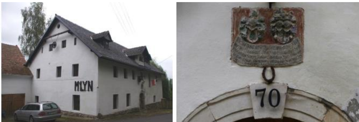
Rysunek 37. Widok na młyn w Szyszkowej Górnej.