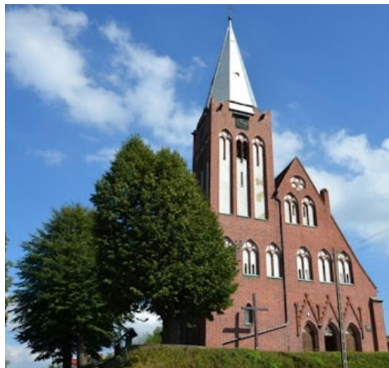
Rysunek 9. Widok na Kościół p.w. Podwyższenia św. Krzyża w Kościelnikach Średnich.

Stan zachowania: Kościół w dobrym stanie zachowania. Ukończono wymianę pokrycia dachowego, która była prowadzona etapami. Wykonano także wszelkie niezbędne elementy odwodnienia (obróbki, rynny, rynny spustowe) oraz instalację odgromową.