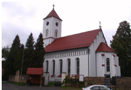
Rysunek 14. Widok na Kościół Wniebowzięcia NMP w Wolimierzu.

Historia: Gdy zakładano Wolimierz jego mieszkańcy uczęszczali na nabożeństwa do Pobiednej, chociaż formalnie podlegali proboszczowi ze Świecia. Jednakże rozwój miejscowości sprawił, iż właściciel miejscowości Grzegorz Meurer poparł dążenia mieszkańców wsi do posiadania własnej świątyni i w 1663 roku wyjednał u elektora Jana Jerzego II zezwolenie na wzniesienie zboru. Wybudowano go już po przejściu miejscowości na własność rodziny