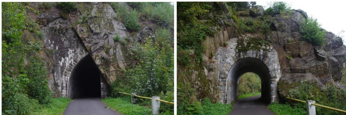
Rysunek 33. Widok na tunele prowadzące nad zaporę złotnicką.

Nad zaporę prowadzi droga przez dwa wydrążone tunele w skale w 1924 roku. Przy tunelu od strony zapory po jego lewej stronie umieszczono figurę lwa. Obiekt pochodzi z Lwiej Góry w Rudawach Janowickich. Lew został odlany z żeliwa wg. projektu Raucha z Berlina. Wagę zwierzęcia szacuje się na 300 kg. Lew w 1965 roku został zrzucony ze skały i przeleżał u jej podnóża kilka lat - o tym świadczy ułamany kawałek ogona. Figura została wywieziona. Obecnie powróciła na swoje pierwotne miejsce. Kolejną ciekawostką jest cylindryczny bunkier, znajdujący się w lesie nad zaporą. Pochodzi najprawdopodobniej z okresu II wojny światowej lub został wybudowany wcześniej.