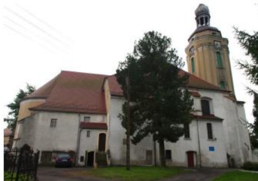
Rysunek 3. Widok na Kościół p.w. Chrystusa Króla w Leśnej.