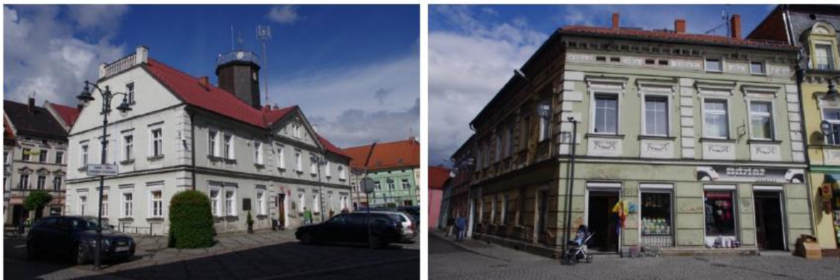
Rysunek 26. Przykład kamienic mieszczańskich na terenie Leśnej - od lewej Ratusz w Leśnej, po prawej kamienica przy ul. Żeromskiego 2.

Architektura mieszkalna Gminy Leśna to budownictwo wyróżniające się kompleksowymi cechami architektonicznymi XVIII, XIX i XX wieku. W Leśnej, w Pobiednej czy w Złotnikach Lubańskich dominują murowane kamienice mieszczańskie oraz wille. Charakteryzują się bogatym detalem architektonicznym nawiązującym do baroku, neoklasycyzmu, secesji lub tworząc swoistą ich eklektyczną kompilację. W południowej części rynku w Leśnej znajdują się domy z charakterystycznymi sklepionymi podcieniami o układzie szczytowym.