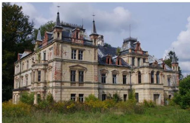
Rysunek 22. Widok na pałac w Kościelnikach Górnych.

Historia: Najstarsza część pałacu została wzniesiona w XVIII wieku. W 1876 roku dobudowano skrzydło oraz północną przybudówkę, zmieniono także wystrój elewacji. Proweniencją budowli są francuskie pałace barokowe z elementami włoskiego renesansu i antyku. Zespół składa się z trzech części: rezydencjonalnej z parkiem, folwarcznej oraz z ogrodów gospodarczych. Park