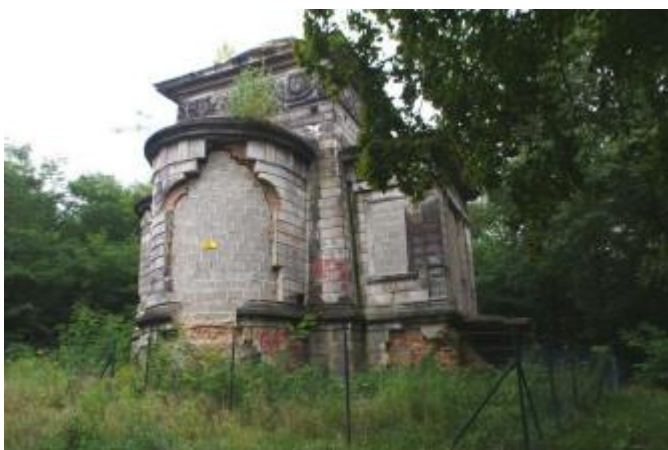
Rysunek 5. Widok na Mauzoleum rodu Wollerów.

Architektura: Addytywna bryła założona na planie krzyża greckiego wpisanego centralnie w kwadrat, którego ramiona są półkoliście zamknięte w kierunku północnym,