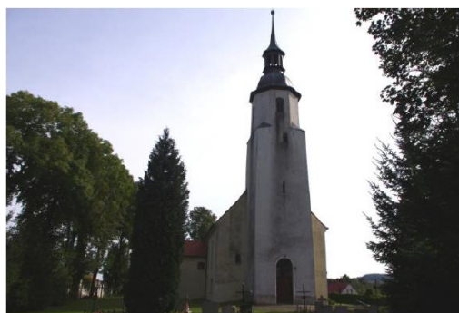
Rysunek 6. Widok na Kościół parafialny św. Antoniego Padewskiego w Grabiszycach Średnich.

Architektura: Prostokątna budowla orientowana, murowana z jednonawowym niewyodrębnionym prezbiterium, nakryta dwuspadowym dachem z ośmioboczną sygnaturą i cebulastym hełmem. Od strony zachodniej znajduje się kwadratowa wieża. Na ścianach zewnętrznych umieszczone są płyty nagrobne von Nostitzów z XVII i XVIII wieku. Na uwagę zasługują stare nagrobki przy murze okalającym teren.