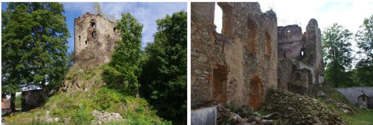
Rysunek 17. Widok na ruiny Zamku w Świeciu.