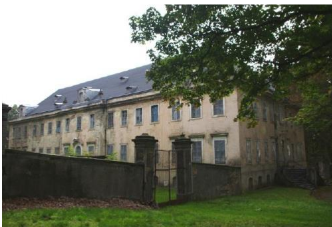
Rysunek 24. Widok na Pałac w Pobiednej.

Historia: Pałac wzniesiony w 1767 roku z polecenia Adolfa Traugotta von Gersdorf w miejsce starego pochodzącego z 1660 roku. Autorem projektu był Konrad Gotthelf Rothe. Rezydencji nadano charakter późnobarokowy z elementami klasycyzmu. Choć pałac był siedzibą rodu to pełnił również funkcje naukowe. Pałac był przebudowywany w 1830 roku, w 4 ćw. XIX wieku,