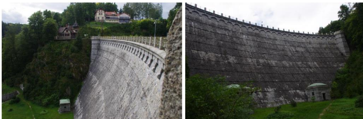
Rysunek 29. Widok na zaporę i elektrownię wodną na Kwisie.

Historia: Budowa zapory rozpoczęła się 5 października 1901 roku. W uroczystościach położenia kamienia węgielnego pod tamę wzięli udział pruski minister rolnictwa Wiktor Podbielski i nadprezydent Śląska Herman von Hatzfeld. Większość zatrudnionych robotników pochodziła z Austrii oraz Włoch. Koszt inwestycji wyniósł 1 270 000 marek. Podczas samej budowy zużyto 32 tony dynamitu, 150 tys. worków cementu, 20 tys. m 3 piasku, 2 400 m 3 wapna oraz 360 ton stali zbrojeniowej. Należy zaznaczyć, iż przy budowie tego obiektu wiele osób straciło życie ze względu na niebezpieczne warunki pracy. Uroczystego otwarcia dokonano 5 lipca 1905 roku. Zaporę usytuowano u wylotu wąskiej przetłomowej doliny Kwisy powyżej Leśnej, na 97 km od ujścia Kwisy od Bobru. Ma 45 m wysokości, z czego 36 m ponad poziomem terenu. Długość ciężkiej zapory kamienno-betonowej w koronie wynosi 130 m, a szerokość 8 m, szerokość w stopie to 38 m. Spiętrza Jezioro Leśniańskie o całkowitej pojemności 15 mln m 3 . Rezerwa powodziowa wynosi 8 mln m 3 . Długość zbiornika wynosi 7 km, szerokość 1 km, a powierzchnia 140 ha. Korpus zapory w górnej części jest zwężony, dzięki czemu obiekt przyjmuje kształt zapory łukowej.