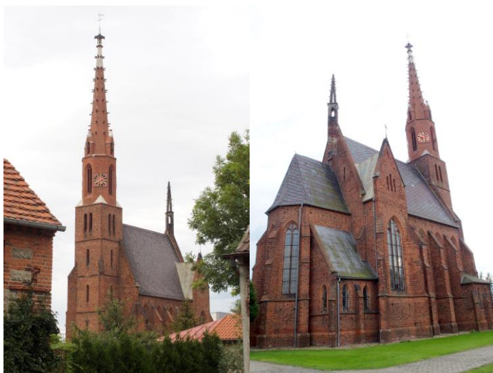
Zdjęcia nr 4, 5. Kościół pw. Niepokalanego Poczęcia NMP w Chrząstawie Wielkiej