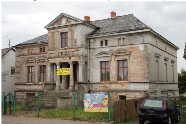
Zdjęcie nr 33. Szkoła podstawowa, ob. budynek mieszkalny w Nadolicach Wielkich, ul. Wrocławska 67

– Szkoła podstawowa, ob. budynek mieszkalny w Nadolicach Wielkich, ul. Wrocławska 67;