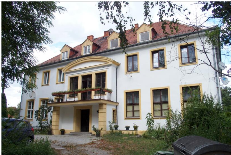
Zdjęcie nr 15. Pałac w zespole pałacowo-folwarcznym w Nadolicach Wielkich