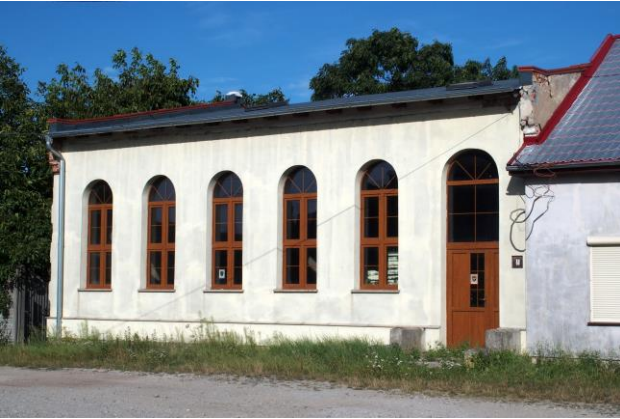
Zdjęcie nr 31. Dom Kultury w Jeszkowicach, ul. Główna 68a

– Dom Kultury w Jeszkowicach, ul. Główna 68a;