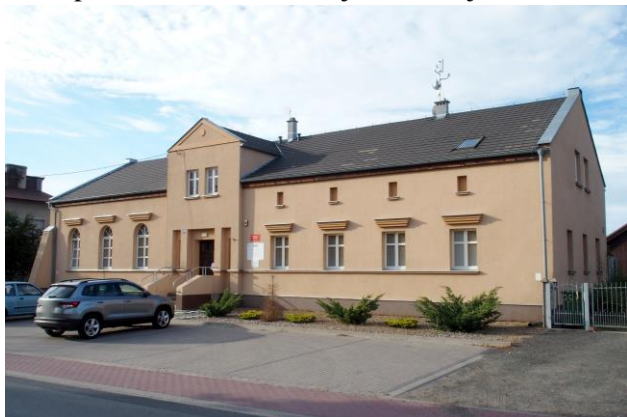
Zdjęcie nr 36. Gospoda, ob. świetlica wiejska w Wojnowicach, ul. Główna 41

– Gospoda, ob. świetlica wiejska w Wojnowicach, ul. Główna 41.