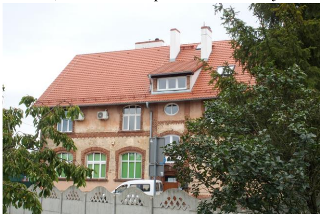
Zdjęcie nr 35. Szkoła, ob. Zakład Gospodarki Komunalnej w Ratowicach, ul. Wrocławska 111

– Szkoła, ob. Zakład Gospodarki Komunalnej w Ratowicach, ul. Wrocławska 111;