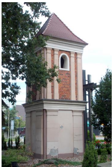
Zdjęcie nr 26. Dzwonnica pożarowa w Czernicy, ul. Wrocławska/Jana Pawła II

– Dzwonnica pożarowa w Czernicy, ul. Wrocławska/Jana Pawła II.