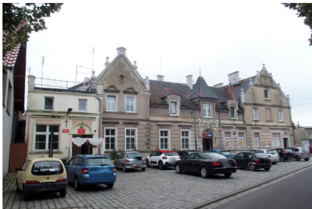
Zdjęcie nr 34. Gospoda, ob. budynek mieszkalno-usługowy (biblioteka, świetlica, sklep) w Ratowicach ul. Wrocławska 50, 52, 52a

– Gospoda, ob. budynek mieszkalno-usługowy (biblioteka, świetlica, sklep) w Ratowicach ul. Wrocławska 50, 52, 52a;