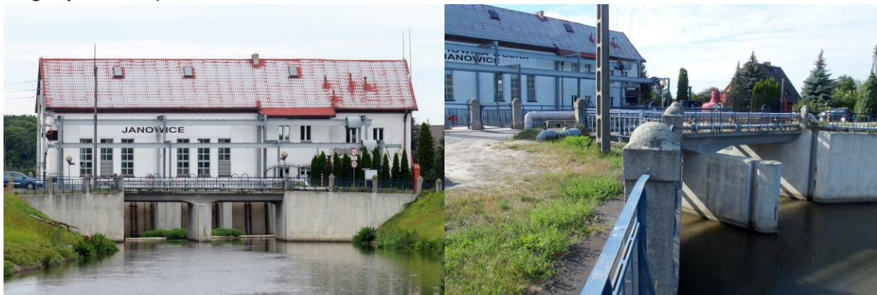
Zdjęcia nr 21, 22. Elektrownia wodna - stopień wodny „Janowice” i most drogowy nad śluzą w Jeszkowicach w zespole

– Infrastrukturę wodną w Jeszkowicach obejmującą: stopień wodny „Janowice”, elektrownię wodną, budynek dyżurki śluzy I, śluzę komorową „Janowice I”, most drogowy nad śluzą, śluzę komorową „Janowice II” i most drogowy nad śluzą II;