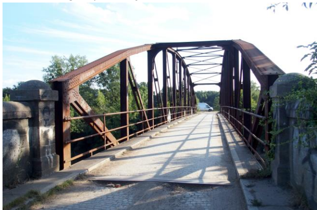
Zdjęcie nr 23. Most drogowy w Gajkowie na Kanale Janowickim

– Most drogowy w Gajkowie na Kanale Janowickim;