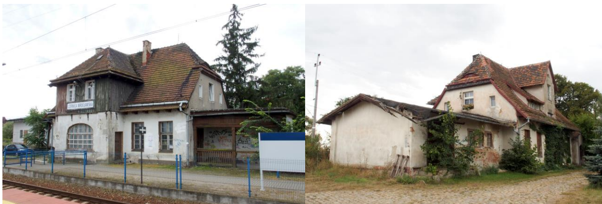
Zdjęcia: nr 17, 18. Dworzec w Czernicy i dworzec, ob. budynek mieszkalny w Nadolicach Wielkich

Budynki dworców pochodzą z końca pierwszej dekady XX w. i prezentują się dość jednorodnie; parterowe, nakryte wysokimi naczółkowymi dachami, z aneksami, o malowniczej bryle.