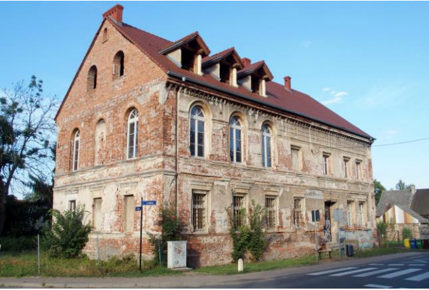
Zdjęcie nr 30. Dawny zajazd Jeltscha, ob. budynek nieużytkowany, Gajków, ul. Główna 50

– Dawny zajazd Jeltscha, ob. budynek nieużytkowany, Gajków, ul. Główna 50;