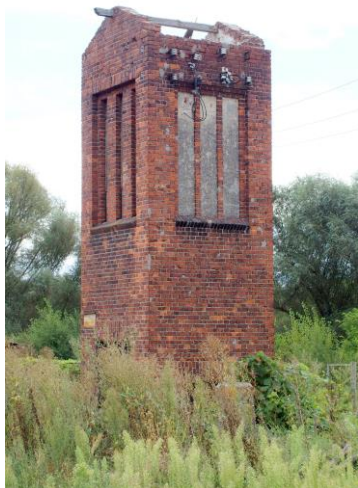
Zdjęcie nr 25. Transformator w Czernicy, ul. Kochanowskiego

– Transformator w Czernicy, ul. Kochanowskiego;