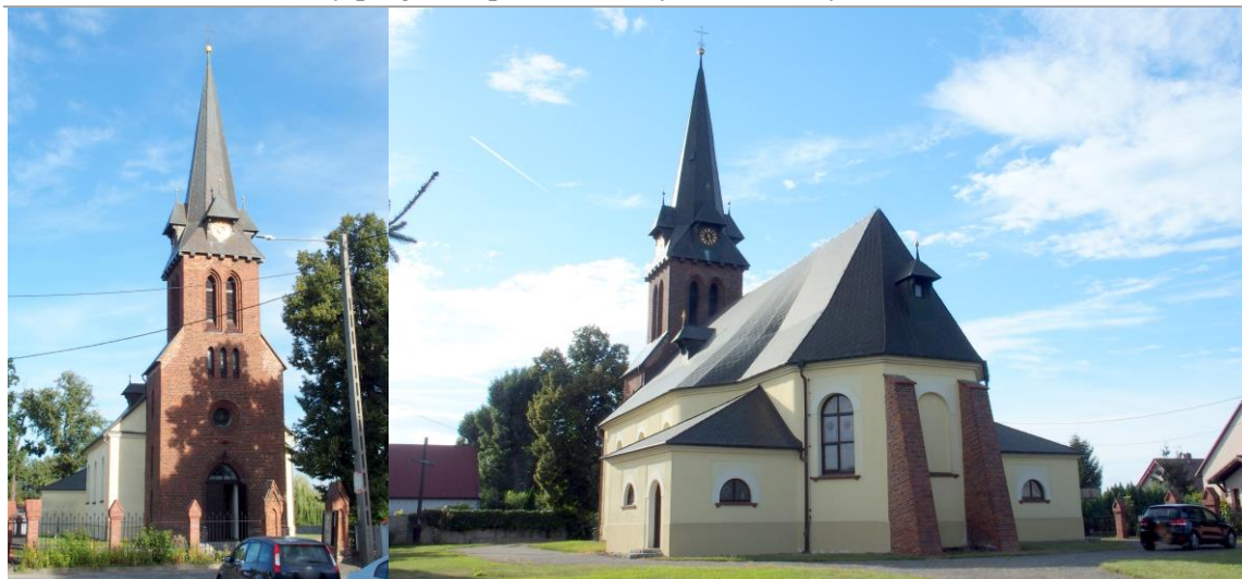
Zdjęcia nr 6, 7. Kościół pw. św. Wawrzyńca w Wojnowicach

Kościół orientowany, jednonawowy, na rzucie prostokąta z poligonalnie zamkniętym prezbiterium flankowanych parą niskich aneksów. Od wsch. dwie ceglane szkarpy. Ściany murowane, tynkowane. W elewacji zach. – murowana z cegły wieża na rzucie prostokąta, zwężonego w czwartej kondygnacji, nakryta dachem czterospadowym przechodzącym w stromy ostrosłup z niewielkimi lukarnami z tarczami zegarowymi – u nasady. Dachy kryte sztucznym łupkiem, okna zamknięte łukiem okrągłym, w wieży – otwory ostrołuczne i koliste tondo.