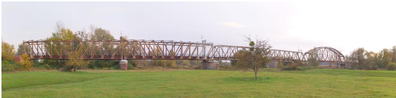
Zdjęcie nr 16. Most kolejowy w Czernicy

Budynki dworców pochodzą z końca pierwszej dekady XX w. i prezentują się dość jednorodnie; parterowe, nakryte wysokimi naczółkowymi dachami, z aneksami, o malowniczej bryle.