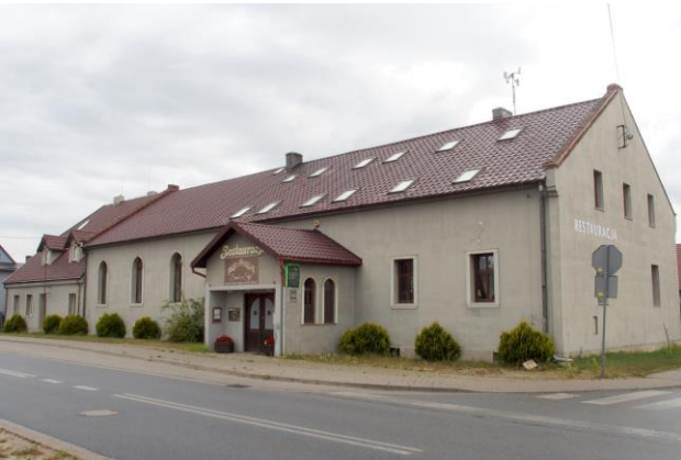
Zdjęcie nr 32. Dom ludowy, ob. restauracja w Nadolicach Wielkich, ul. Wrocławska 64

– Dom ludowy, ob. restauracja w Nadolicach Wielkich, ul. Wrocławska 64;