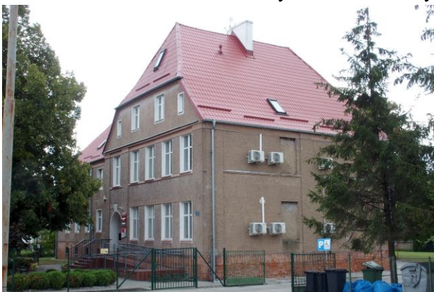
Zdjęcie nr 29. Szkoła Podstawowa, ob. Gminny Ośrodek Pomocy Społecznej w Czernicy, ul. Wrocławska 78

– Szkoła Podstawowa, ob. Gminny Ośrodek Pomocy Społecznej w Czernicy, ul. Wrocławska 78;