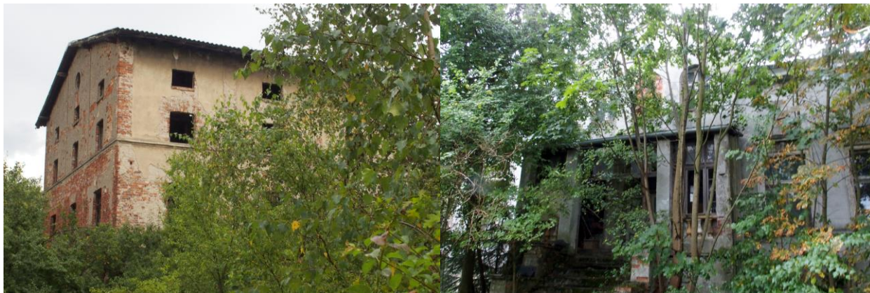
Zdjęcia nr 19, 20. Dawny budynek młyna i dawny dom młynarza w zespole młyna w Nadolicach Wielkich przy ul. Rzecznej 53

Kolejnym elementem technicznego dziedzictwa kulturowego są młyny, nawet całe zespoły młyńskie, jak zespół młyna w Nadolicach Wielkich przy ul. Rzecznej 53 (rejestr zabytków), obejmujący zbożowy młyn wodny, dom młynarza, ob. budynek mieszkalny i chlewnię z gołębnikiem, datowane na 2 poł. XIX w. i pocz. XX w. Obiekty zespołu młyna są w bardzo złym stanie, popadają w ruinę.