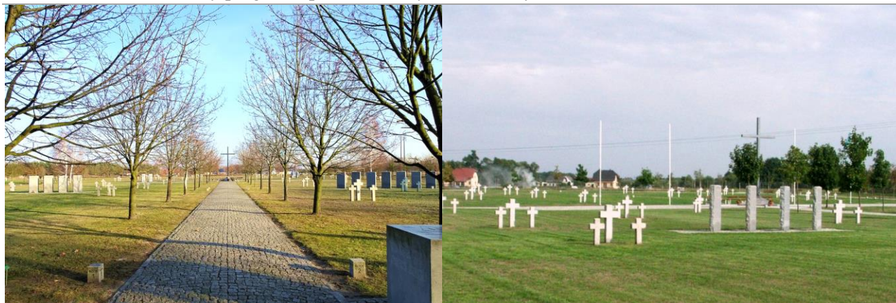
Zdjęcia nr 1, 2. Park Pokoju w Nadolicach Wielkich

Obecnie cmentarz ma powierzchnię 3 ha obsadzoną przeszło 600. drzewami. Do końca 1998 r. spoczęło tu 6 310 zmarłych, w 2002 r. było tu pochowanych 12 000 zmarłych, zaś w 2016 r. liczba ta zwiększyła się do 17 tys. Zdecydowana większość zmarłych pochodzi z obszaru Wrocławia (do 2001 r. było to 10 800 osób). Leżą tu w grobach zbiorowych żołnierze Wehrmachtu, esesmani, członkowie Volkssturmu, a także około 300 osób cywilnych poległych podczas walk na Śląsku. Ponadto są tu też nieliczne zwłoki żołnierzy zmarłych w okresie międzywojennym, przeniesione z cmentarza garnizonowego we Wrocławiu.