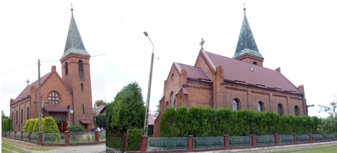
Zdjęcia nr 13, 14. Kościół pw. św. Antoniego w Ratowicach

Kościół pw. św. Antoniego, dawny ewangelicki w Ratowicach , zbudowany w 1894 r. wg projektu architekta Benna Kohlera, neoromański. Budowla z trójkondygnacyjną wieżą o wysokości 34 m. W środku są organy zbudowane ok. 1894 r. przez firmę Schlag & Söhne ze Świdnicy.