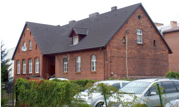
Zdjęcie nr 28. Szkoła parafialna, ob. budynek mieszkalny w Chrzastawie Wielkiej, ul. Wrocławska 15-17

– Szkoła parafialna, ob. budynek mieszkalny w Chrzastawie Wielkiej, ul. Wrocławska 15-17;