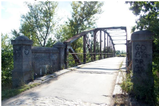
Zdjęcie nr 24. Most drogowy na kanale Janowickim w Kamieńcu Wrocławskim

– Most drogowy na kanale Janowickim w Kamieńcu Wrocławskim.