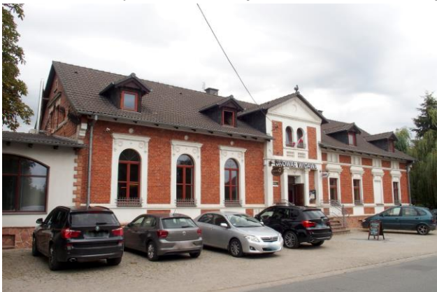
Zdjęcie nr 27. Dom Ludowy, ob. restauracja w Chrzastawie Małej, ul. Wrocławska 97

– Dom Ludowy, ob. restauracja w Chrzastawie Małej, ul. Wrocławska 97;