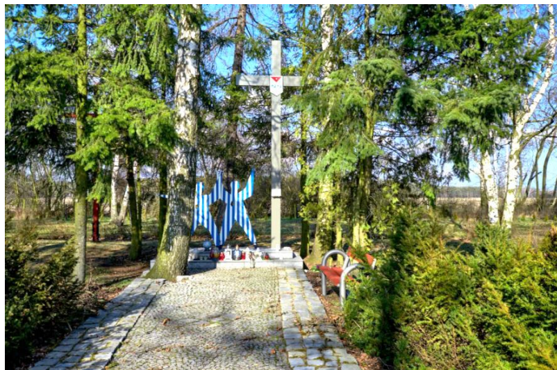
Zdjęcie nr 3. Pomnik poświęcony ofiarom niemieckiego obozu pracy wychowawczej AEL Rattwitz