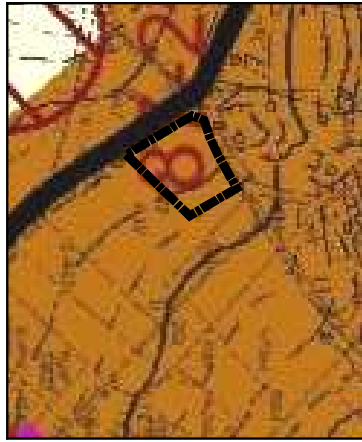
WYRYS ZE STUDIUM UWARUNKOWAŃ I KIERUNKÓW ZAGOSPODAROWANIA PRZESTRZENNEGO GMINY STRZELIN (UCHWAŁA NR XXIII/311/16 Z DNIA 28 CZERWCA 2016 R.)